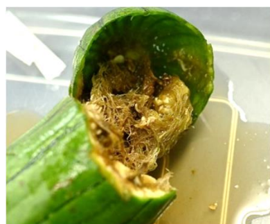
加害されたヘチマ