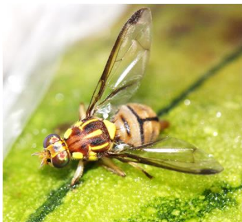
セグロウリミバエ成虫