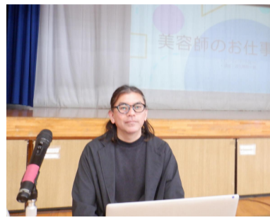
美容師 ビューティーモードカレッジ講師