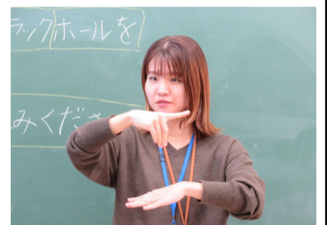
北丘小卒業生の講師

聴覚障がいのある講師に指導してもらい、始めは「難しい、覚えられない！」と戸惑っていた児童も一生懸命練習し、習得する姿に講師も驚いていました。発表会も大成功でした！