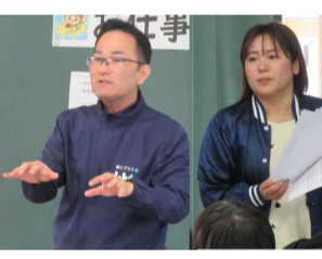
ゲームプログラム