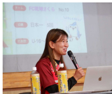
スポーツ選手 FC琉球さくら所属

3業種の講師から働くことの意味や大切さ、苦勞などを聞くことで、将来の夢に向かって今から何をしたらいいのかを考える機会となりました。