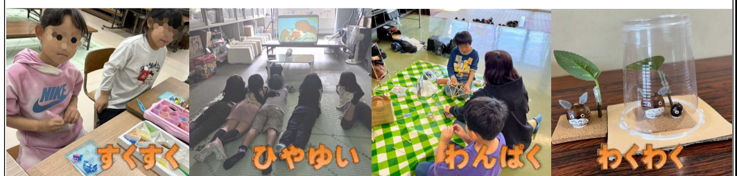
すくすく ひやゆい わんぱく わくわく