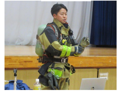
消防士(津嘉山小卒業生) 東部消防組合消防本部