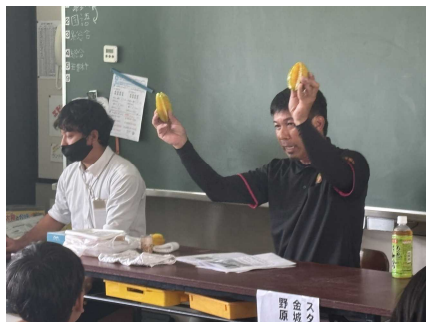
スターフルーツ講話