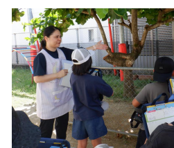
南風原やまびこ 保育園