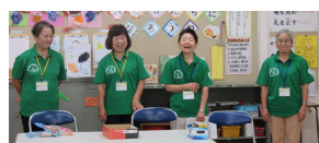
かりゆし長寿大学校