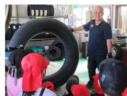
上原タイヤ道 サービス