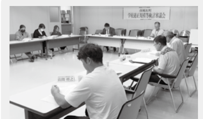
▲10月25日に開催された第1回学校適正規模等検討審議会