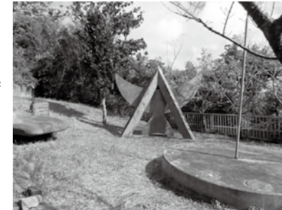
「飛び安里」初飛翔顕彰記念碑