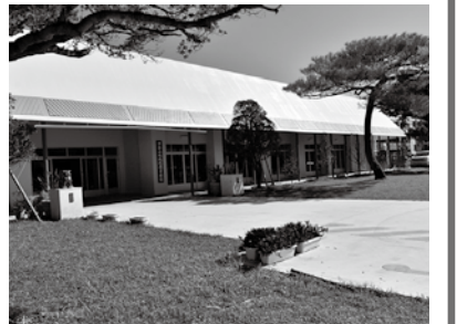
津嘉山地域振興資料館