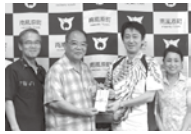
瑞泉酒造株式会社様からの寄付金贈呈