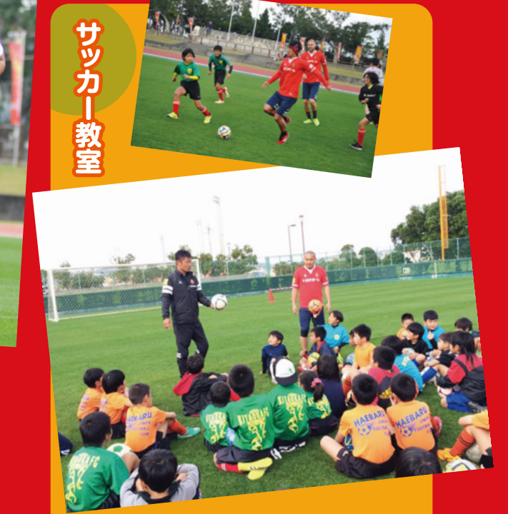
2月11日には、町内のジュニアサッカー チームを対象としたサッカー教室が開催され、 グランパスの選手とサッカーを楽しみました。