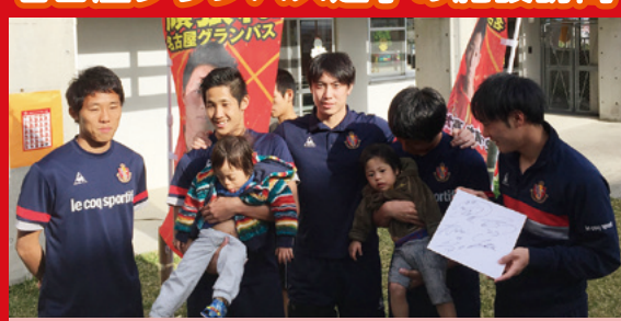
沖縄中央育成園あさひ寮を名古屋グランパス5名 の選手が訪問し、こども達とシュートゲーム等を行 いふれあいました。