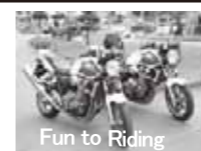
Fun to Riding