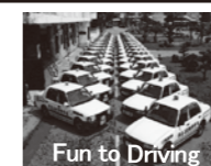
Fun to Driving