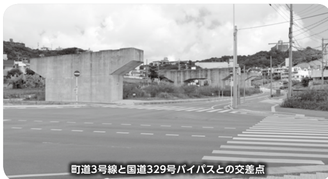
町道3号線と国道329号バイパスとの交差点

副町長 ガードレールの設置と道路利用者の安全確保のためカラー舗装の要請を行っていく。