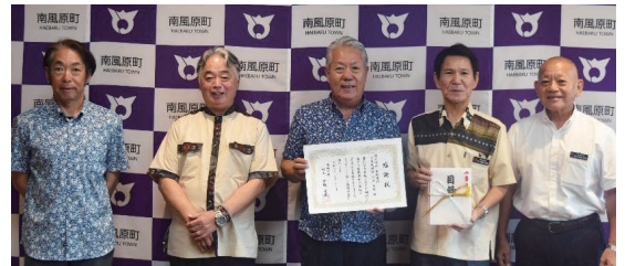
▲株式会社南成建設様