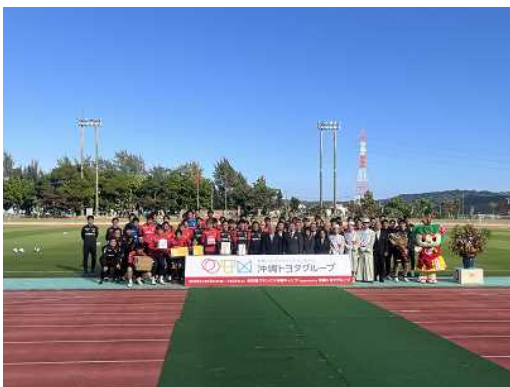
▲名古屋グランパス歓迎セレモニー