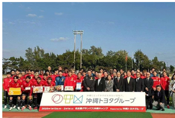
▲サッカーキャンプ歓迎