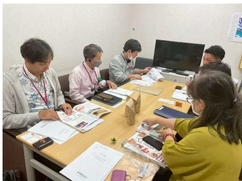
▲販路開拓商談会の様子