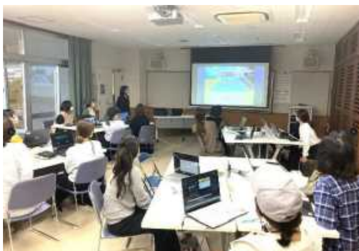
▲映像クリエイター研修の様子 (動画やサムネイル画像を各自で作成・お披露目)