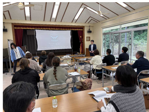
▲販路開拓視察研修の様子