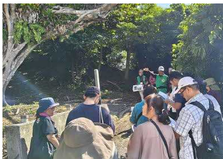
▲兼城まち歩きツアー

町民の皆様が本町の歴史や文化を学ぶ機会を創出するとともに観光誘客を図るため、地域ガイドを活用したまち歩きツアー等を実施する事業です。