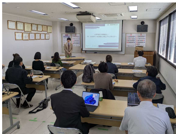
売上UPセミナーの様子