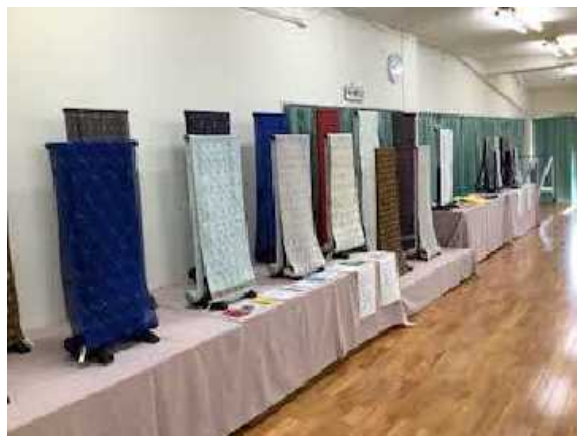
▲令和7年度後継者育成事業研修生作品