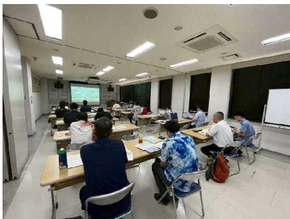
経営革新セミナーの様子

商工会は、地域の商工業の振興と住みよい地域づくりのため、町内の商工業者によって組織された総合的経済団体です。指導団体として、その地域内にあるすべての商工業者について、公正な立場から地域商工業の総合的な改善や発展を図り、社会一般の福祉の増進に取り組んでいます。活力ある魅力的なまちづくりに寄与している町商工会に対し、町も補助金を支出しています。