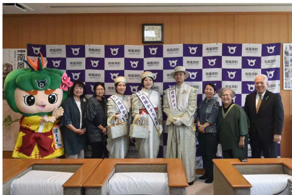
▲琉球かすり大使ユニフォームお披露目式

ふるさと博覧会で選出された琉球かすり大使は、各種イベントに出席し、南風原町と琉球絣・南風原花織のPRします。琉球かすり大使がイベントに参加した際は、謝礼金をお支払いしています。また、2年に1度新たに「かすり大使」を選出し、大使が着用する琉球絣・南風原花織のユニフォームを制作します。