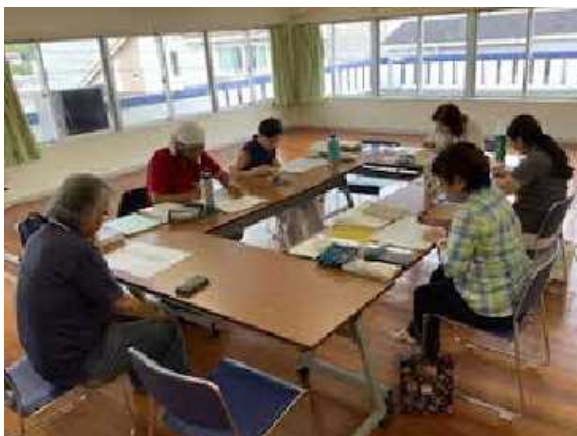
▲令和7年度後継者育成事業研修の様子