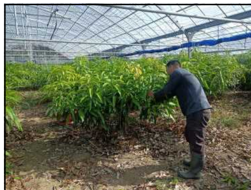
▲ 交付対象者のほ場

交付額は、基本月12万5千円(最大で年間150万円)を最長3年間までとなりますが、令和7年4月1日以降営農開始した農家については、月額13万7500円(最大で年間165万円)となっております。