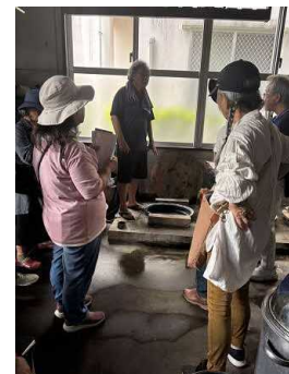
▲ガイド研修かすりの道