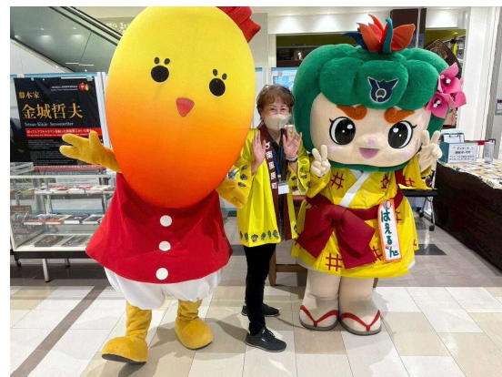
▲ヒーローイベント(イーアス豊崎)