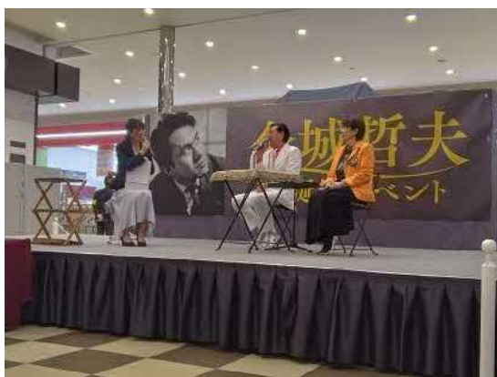
▲金城哲夫生誕地イベント

南風原町が輩出した人材の功績を継承するとともに、観光客を本町に誘導するため、南風原町が輩出した人材の功績や経歴、所有品の展示等のイベントを実施します。