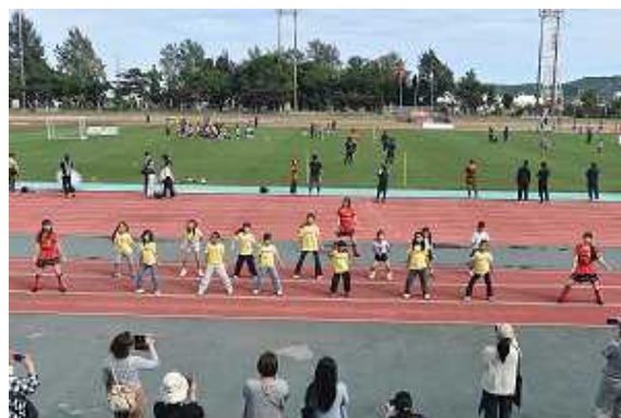
▲チア・サッカー教室