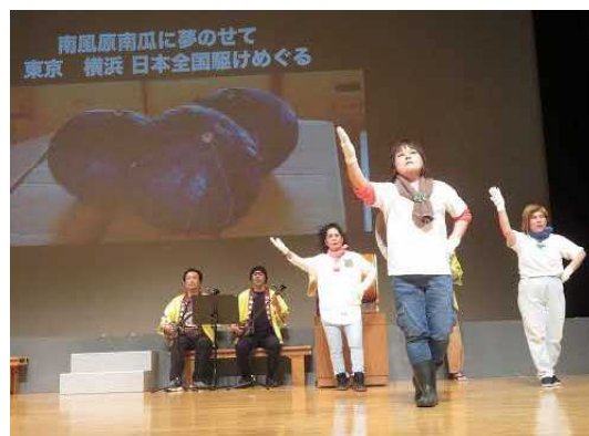
▲ヒーローを題材とした舞台化