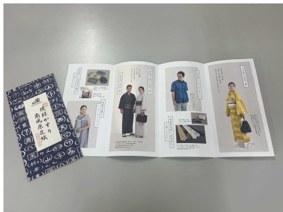
▲パンフレット制作