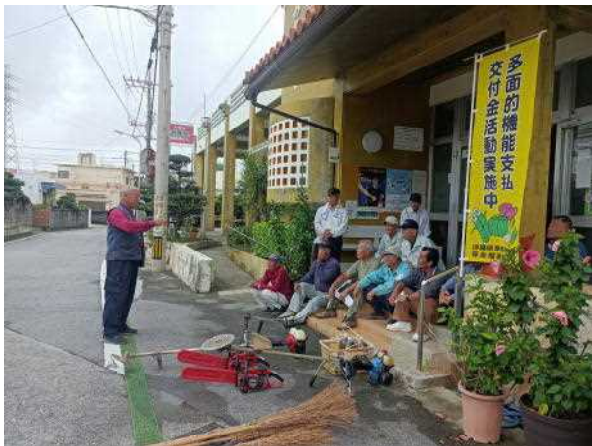
▲清掃箇所確認状況