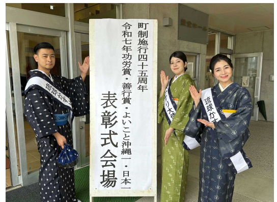
▲琉球かすり大使公務の様子