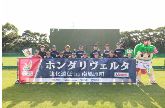
▲ホンダリヴェルタ(ソフトボール)合宿