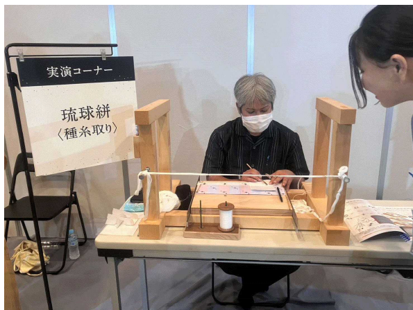
▲展示販売会での実演

南風原町の特産品である琉球かすりの振興を目的に、琉球絣事業協同組合が行う、研修・派遣事業・販路開拓宣伝活動・展示即売業等の経費に対して補助しています。