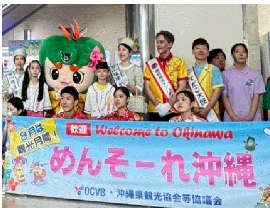
▲観光の日イベント(那覇空港)