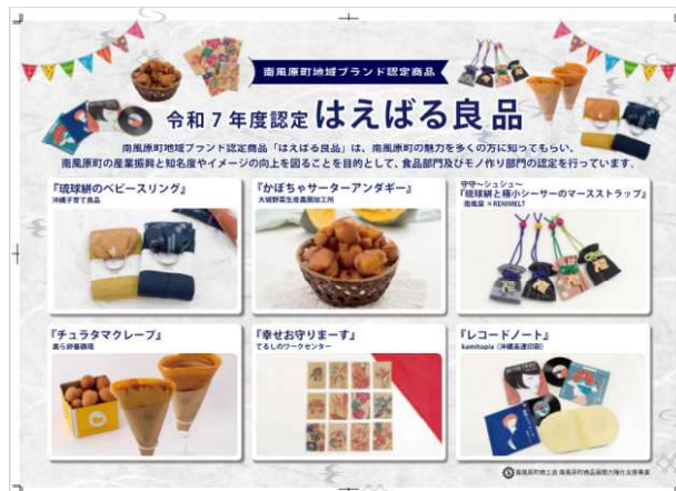
▲令和7年度「はえばる良品」認定商品