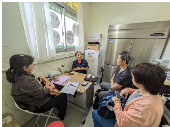
▲商品改良専門家派遣の様子