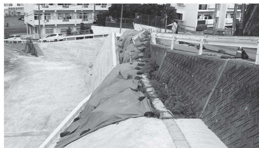
町道143号線 現在の様子

旧業務スーパー付近の町道143号線について、改良工事を行います。工事期間中は全面通行止めの期間をできるだけ短くするよう、片側交互通行なども行いながら工事を行うと説明がありました。