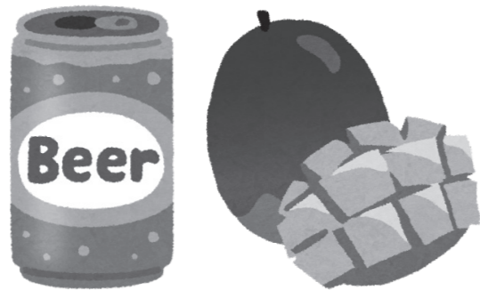
送料の大きい返礼品

答 減額要因として、令和5年度に返礼品に対する考え方が厳格化され、その中で送料の影響があります。本町においては送料が大きいマンガやビールなどの返礼品が多いため、その分不利になってしまい、他の自治体に流れつつあります。