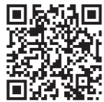
第6次総合計画について