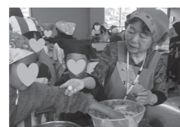
◀かぼちゃ団子作りの様子

南風原の特産物であるかぼちゃを使用してかぼちゃ団子作りをしました。地域のお料理名人さんから丁寧に教えていただき、お友だちと協力して美味しい団子ができました。教師からは「実際にかぼちゃを食べることで、更に学びが深まりました」と感想がありました。