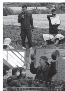
▲かぼちゃ畑見学(上) J A 津嘉山集出荷場見学(下)

地域の特産物である津嘉山かぼちゃを育てるうえでのさまざまな工夫や努力についてお話を聞いた後、実際に畑見学を行い確認をしました。その後、J A 津嘉山集出荷場見学を行いかぼちゃが集出荷され食卓に届くまでの流れを学びました。