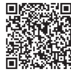
▲学校応援隊はえばるについて