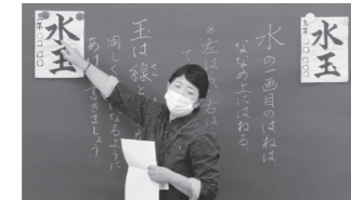
◀津嘉山小書写ボランティア

町内4つの小学校では、年間を通して総勢15人の講師に書写指導していただきました。道具の使い方、姿勢、上手く書くコツなどを教わり、最後の授業では成長した力作に講師も教師も児童も感無量でした。ご指導ありがとうございました。