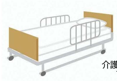
介護用ベッド及び マットレス