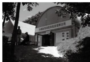
20号壕入口(写真左)と壕内部(写真右)、飯あげの道(写真右下)