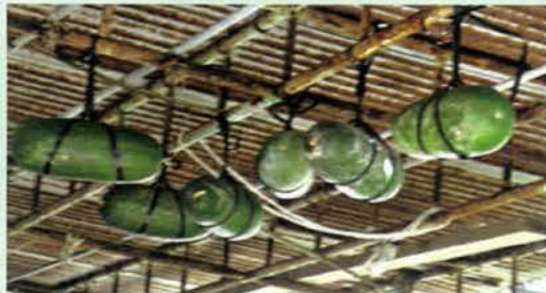
風通しの良い軒下につるされた冬瓜（スプイ）

かつては広く稲作が行われていたが戦前はサトウキビを主作とし、加えて季節ごとに冬瓜（山川スプイ）・ヘチマ等も生産しました。1923(大正12)年輕便鉄道が開通すると、連日那覇の農連市場へ野菜の出荷が急増し、市場を賑わせました。1982(昭和57)年から土地改良事業が始まり、露地栽培からハウス栽培へ作物転換が図られ、近代農業が営まれるようになりました。現在では県下で屈指の野菜産地として知られています。近年はヘチマが日本一の生産量を誇り、カボチャの拠点産地認定を受けています。日頃より、ユイマールで土地改良施設の良好な維持管理を行い、農産物の安定生産・供給に寄与しており、毎年行われている農業祭において、各種生産部門の奨励賞や、優秀な成績を修めた子供たちへの表彰などを行っています。集落一体となったふるさとづくりを進めている事が評価され、2010(平成22)年に土地改良区水利組合が「沖縄ふるさと百選」に認定されました。