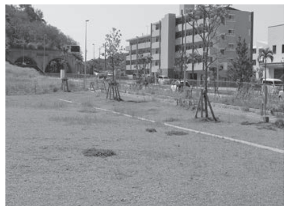
防球ネットがない 津嘉山公園

都市整備課長 サッカー、野球などは禁止である。近隣住民の憩いの場、レクリエーションの場を目的としている。令和7年度からパークゴルフ場の供用開始で管理者を設置して対応する。