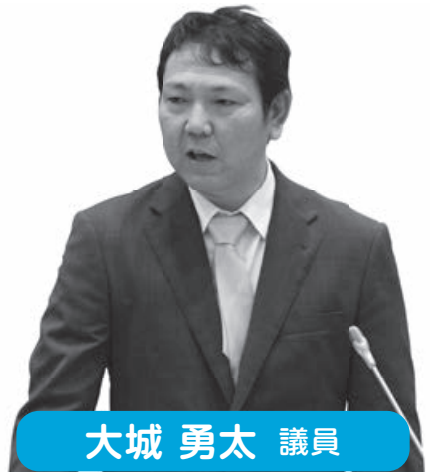
大城 勇太 議員