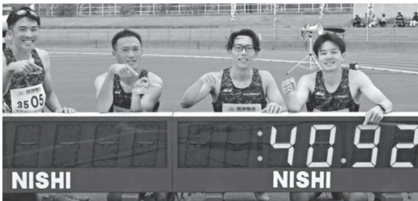
町内出身者400mリレー世界記録