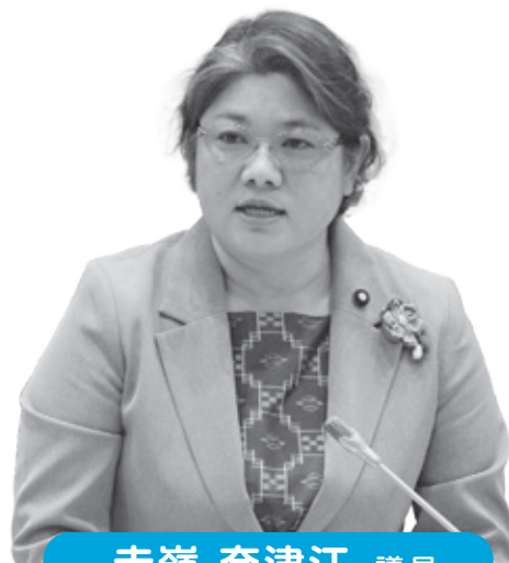
赤嶺 奈津江 議員

平時において自らの整備状況を確認して災害時に必要となる防災機能設備等の容量や個数などを検討し、充実強化を推進することとなっている。今後協議しながら進めていく。