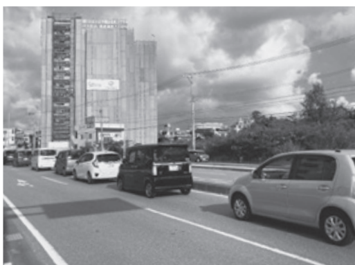
町内最大123戸のマンションと現在も渋滞する子ども病院前

町長 実際に発生してない事で関係機関に働きかけはできない。事業者との開発協定で、交通事情の抑制・安全配慮・通学路の交通ルール等は遵守されると認識する。