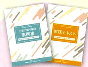
支援プログラム 企業の取り組み事例集&実践テキスト