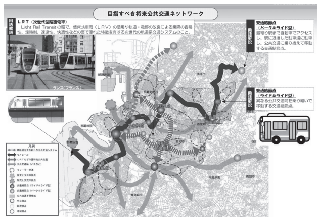
那覇市ホームページより

まちづくり振興課長 那覇市では、域内交通、市内の交通手段としている。南風原町のこども病院辺りまでの計画がある。令和8年度には関係機関との協議、令和12年度に整備予定という計画のようである。