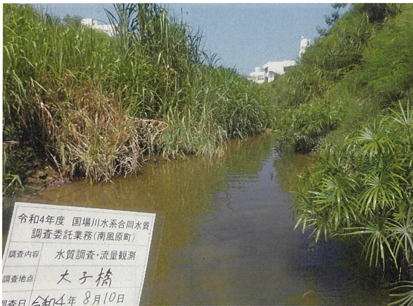
※河川工事中のため、影響を避け、約50m上流で採水