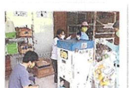
リサイクル活動風景