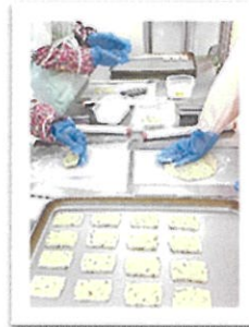
焼き菓子製造工程