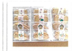
乾物ギフトセット