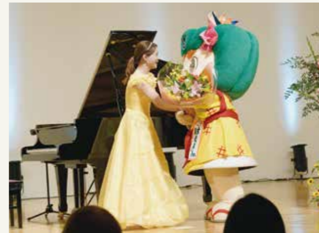
はえるんからの花束贈呈