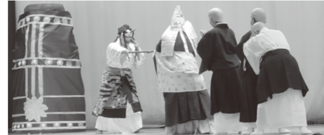
組踊「執心鐘入」を演じる南風原高校の皆さん

郷土文化コース生が、伝統芸能組踊や南風原町の芸能を上演し、児童は組踊の名乗りや着付け、踊りの体験をしました。