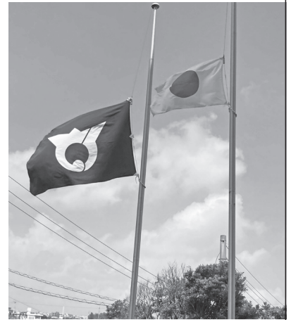
役場での半旗掲揚