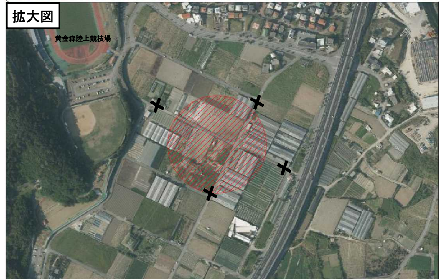
拡大図(円内は危険立入禁止区域であり、歩行者も侵入禁止です。)