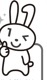
マイナンバーPRキャラクター マイナちゃん

住民票の住所に通知カードとともに届いた個人番号カード交付申請書を使用して、 郵送による申請 又はスマートフォン・パソコンによる WEB申請 を行うと、交付通知書(はがき)がご自宅に届きます。