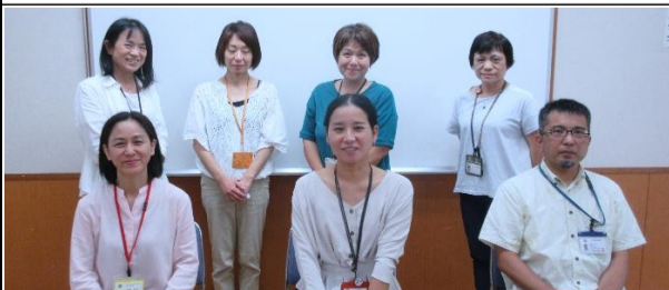
八重瀬町職員とコーディネーター（前列）

八重瀬町コーディネーターと事務局職員が、南風原町の平和学習の取り組みについてお話を聞きたいと訪れました。八重瀬町の現状と課題を聞き、南風原町での取り組みを紹介し、取り組み方や工夫について話し合いました。