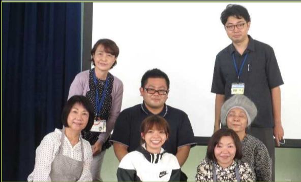
認知症サポーター養成講座劇団の皆さん

4年生は保健福祉課の職員を講師に迎え認知症について学習しました。職員の皆さんによる劇は、認知症の方の対応の仕方について子ども達の興味をひき「自分に出来る事は何か」を考える、とても理解しやすい学習になりました。