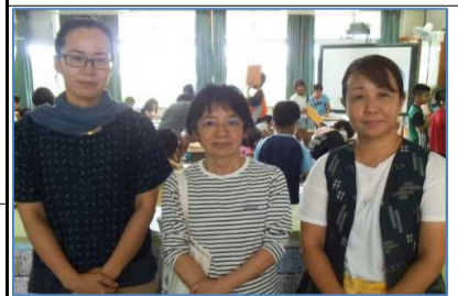
當大又 山城吉 ア美ゆ ヤ枝か 乃子り ささ んんん

かすり組合員3名の方に講師になっていただき、「琉球かすり」の興りやかすりを作る時の苦労や工夫についてお話下さいました。調べ学習では分からないこともたくさん学ぶことができました。又、講師の皆さんの琉球かすりに対する今後の想いなども聞くことができ、地域学習の素晴らしさを知りました。