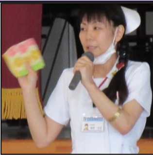
タバコを吸うと、どのくらい苦しいか疑似体験