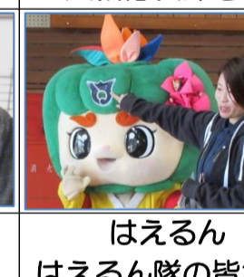
はえるん はえるん隊の皆さん