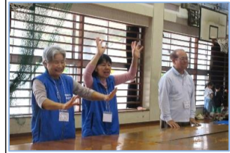
グムグークワーエー