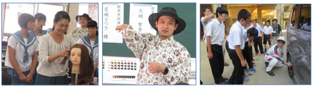
美容室ビューティーエイト・ホンダカーズ沖縄の皆さん、ありがとうございました。