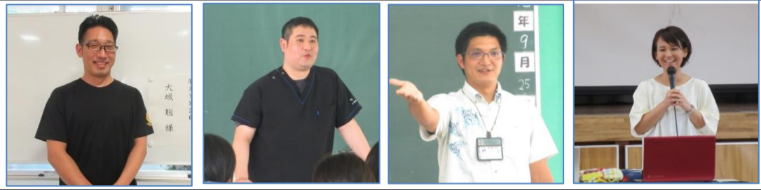
咲レストラン・老人介護施設嬉の里・中央公民館・宮平保育所の皆さん