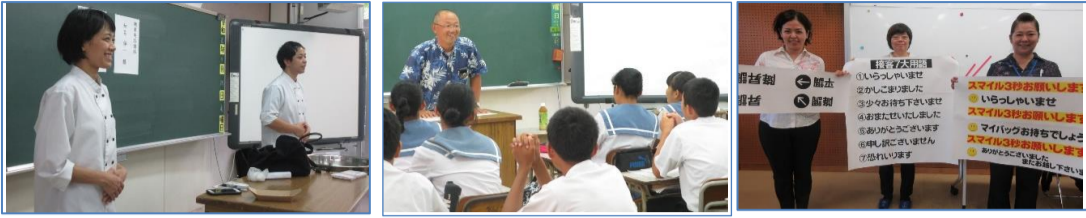
美ら卵養鶏場とCAKE&EGG・ユインチホテル南城・丸大スーパーの皆さん

2年生(251名)では、職場体験学習受け入れ先の83カ所の事業所等から9職業種の講師を招き、職場で求められる人材やマナー、職業実践の実演を学びました。講師の皆さんはそれぞれに工夫を凝らし仕事内容や、やりがい等も話してください、生徒たちはとても充実した学習になりました。