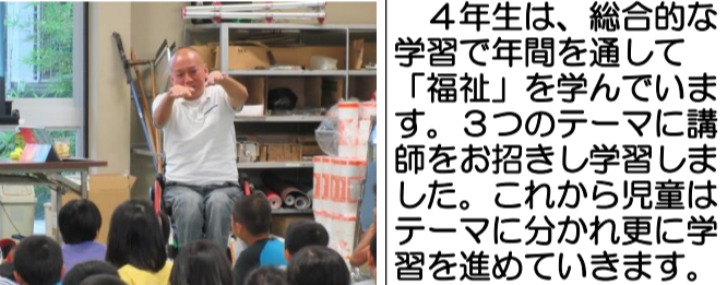
4年生は、総合的な学習で年間を通して「福祉」を学んでいます。3つのテーマに講師をお招きし学習しました。これから児童はテーマに分かれ更に学習を進めていきます。