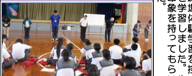
た徒え、二年生「社会人マナー」は一人一人の感想が先必要ありません。マナーは職場体験学習を控いた。印象を学習しました。