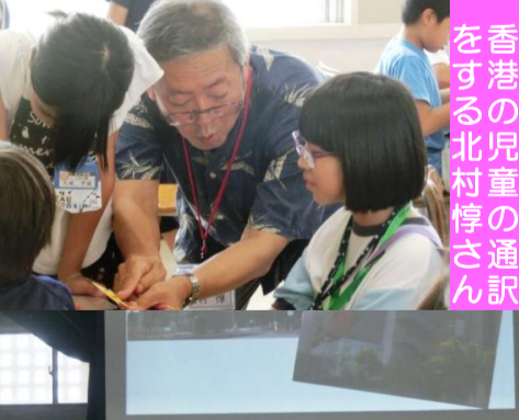
香港の学校紹介をする子供達

4年生が修学旅行で訪れた香港の子供達と交流しました。体育館で全生徒と列車ゲームを楽しんだ後、各クラスで折り紙手裏剣作りを行いました。