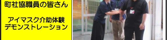
町社協職員の皆さん アイマスク介助体験 デモンストレーション

あなたも学校の応援団になりませんか? ボランティア募集中! ★未来を担う南風原町の子供たちを地域で育てましょう★