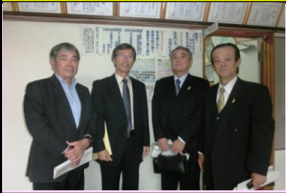
南風原中模擬面接官 町保護司、南中校外生徒指導員、 那覇南ロータリークラブの方々

町保護司、那覇東・那覇南ロータリークラブ、島尻青年会議所、沖縄県中小企業家同友会南部支部会員等地域の多くの企業の代表者等の方々にご協力いただきました。ありがとうございました。