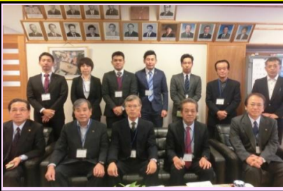
南風原中模擬面接官 町保護司、島尻青年会議所、 那覇東ロータリークラブの方々

本番さながらの模擬面接にガチガチの生徒達です。頑張ってほしいです。という声も聞かれました。