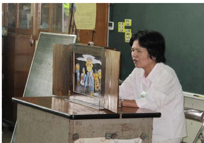
たんどどか機さんつタ● のもる買い発 ー「 話達達とうま弾沖「南 にはは思のしを縄学風 聞、興うにた通戦芸原 き最味?い。しの負町 入後津「く「て様の文 つま々のら戦説子上化 てで・質お闘明を地せ い上・問金機し写克ン ま地・にがをて真哉 しさ子子か一下やさ