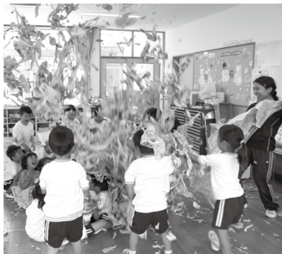
▲幼稚園で新聞紙遊び