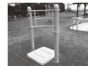
ツイスト (腰の柔軟と足の裏のツボをマッサージ)