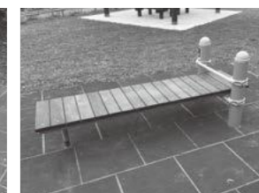
シットアップ (腹直筋を鍛える運動)