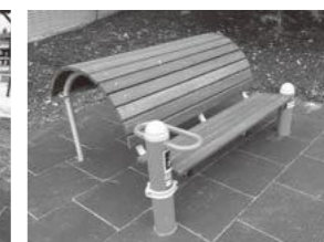
背伸ばしベンチ (背を伸ばす運動でリラックス)