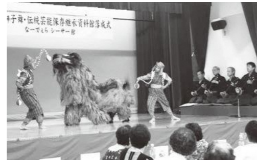
8月19日宮平地域振興資料館 落成式

寄贈され、その後、宮平区民の努力により宮平獅子舞は途切れることなく今日まで継承されてきました。 地域の文化振興を 目指して 「宮平獅子舞」という貴重な文化財を今後とも保存継承していく上で大きな課題となっていたのが、高温多湿な気候において保存の難しい獅子の保管と後継者の育成でした。そこで、獅子の保管展示場所、獅子舞を練習・披露する後継者育成の場として、沖縄振興推進交付金を活用した資料館の整備が行われました。