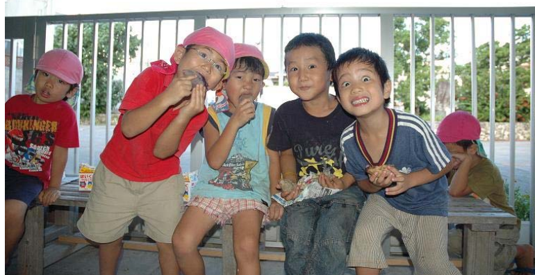
▲宮平保育所の芋ほり