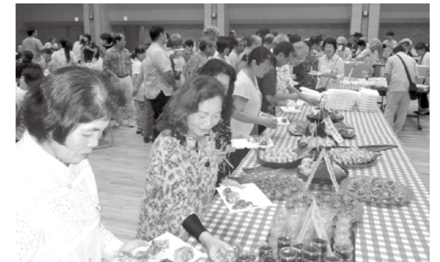
「地元野菜を使った手作り料理」

8月28日学校応援隊はえばるボランティア懇談会が中央公民館で開かれました。「学校応援隊はえばる」は、ボランティアで小中学校を学習支援する活動で、昨年度は407名が参加しました。懇談会には約220名が参加し、料理ボランティア南風原グループの地元野菜を使った手作り料理が振る舞われ、参加者はなごやかに懇親を深めました。また、生徒たちからの感謝の言葉を込めたビデオレターでは、目を熱くするボランティアさんもいて、参加者は「子供たちがこんなに感謝してくれてとてもうれしい。やってよかった。これからもがんばりたいです。」と話していました。