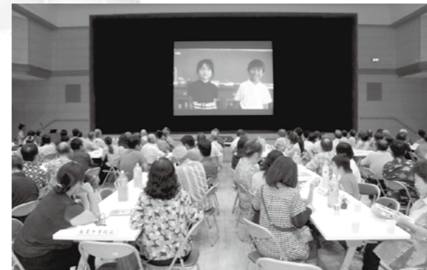
「子供たちからのビデオレター」