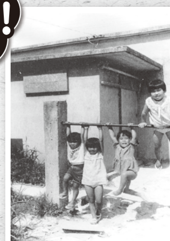
公民館の前で遊ぶ子どもたち(新川)

このように、写真を見て思い出話に花が咲きそうな懐かしい写真を大募集中です。戦前や戦後の写真、昭和40年代頃の写真、地域行事、風景写真などの情報を南風原文化センターにお寄せください。お待ちしております。