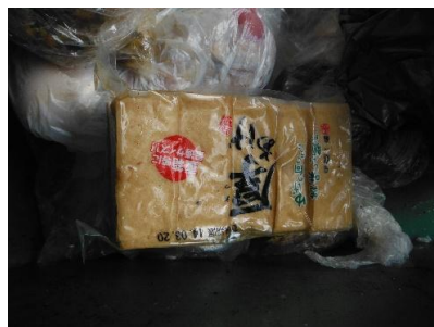
パックのままの厚揚げが・・・