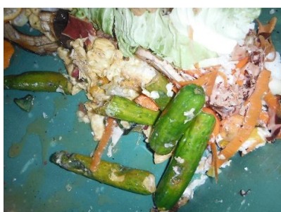
出番がなかったきゅうりたち