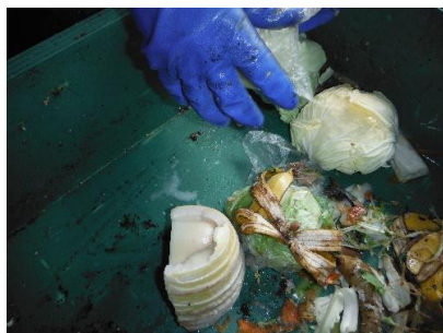
キャベツとたけのこ、まだ使えるよ！

下の写真は、「はえぼる版リサイクルルーフ」の全作業を行っている「NPO法人のぞみの里」が回収した家庭から出た生ごみです。まだ食べられそうな野菜や食材などが、生ごみとして回収されています。