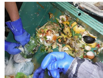
のぞみの里では、たくさんの生ごみを手作業で細かくしています。