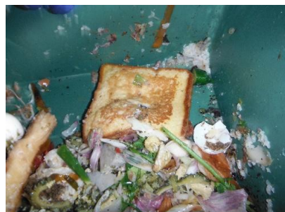
食パンもったいない！