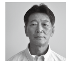
■新川 はなしろ 清和 花城 清和

不発弾探査要望箇所の募集 沖縄県では「広域探査発掘加速化事業」として、主に民間地での不発弾等の探査・発掘事業を実施しています。 対象/(1)探査予定面積が100㎡を超えること (2)地主及び小作人が不発弾等の調査・探査・発掘工事に同意同意書を添付していること ※県の予算の範囲内で探査・発掘事業を実施するため、要望しても探査を実施することができないこともあります。 申込期限/5月31日(金) 申込・問/総務課 ☎889-4415