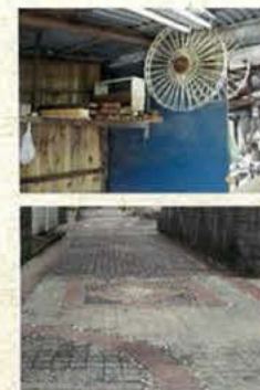
かすりのパッチワーク