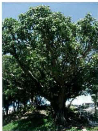
公民館の裏に植えられているデイゴの木。毎年みごとに花を咲かせます。

このシーサー、ご覧のとおり形や表情が一般のシーサーと違ってユニークなので知られています。沖縄戦で焼失したもう一匹は、どんな顔形をしていたのでしょうかね。