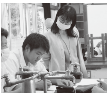
地域のみなさんが見守っています

毎週水曜日のノ一部活デーに生徒の居場所として放課後学習会を開催している南星中では、自主的に集まった生徒達がグループで英会話を楽しんだり、黙々と宿題をする姿があります。南風原中でも定期テスト前に学習ボランティアが生徒と学習しています。