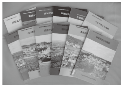
全12字の戦災調査報告書

今年で沖繩戦の終戦から七十九年が経過します。戦争体験者からお話を聞くことが難しくなる中、「戦争遺跡」とおして戦争と平和について学ぶ機会が増えていくことと思えます。 その戦争遺跡として、南風原町が全国で初めて文化財に指定されたのが「沖繩陸軍病院南風原壕」です。この全国初の取り組みのきっかけには、一九八三年から全ての字でおこなわれた「戦災調査」がありました。 南風原町の戦災調査は一九八三年から一九九六年にかけておこなわれました。調査は戦前に存在した家一軒一軒を訪ねておこなわれました。引越した家があれば引越先へ、一家全滅の家のことは隣近所や親戚を探すなどして調査はすすめられました。 この調査により、集落の人や日本軍が掘った壕の場所、兵士が住んでいた家、疎開をおこなった家、一家全滅した家など、各字、各家庭がどのような沖繩戦を経験したのか記録されました。この積み重ねで「南風原の沖繩戦」が明らかにになり、陸軍病院壕と地域の関わりもわかっていきました。 そして戦災調査の中で、重要な調査員の役目を果たしたのが、字出身の高校生や青年、主婦など地域の方々でした。戦争体験者にとり、戦争体験を語ることは、時にとても