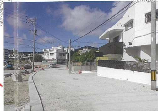
津嘉山539番地周辺 工事中