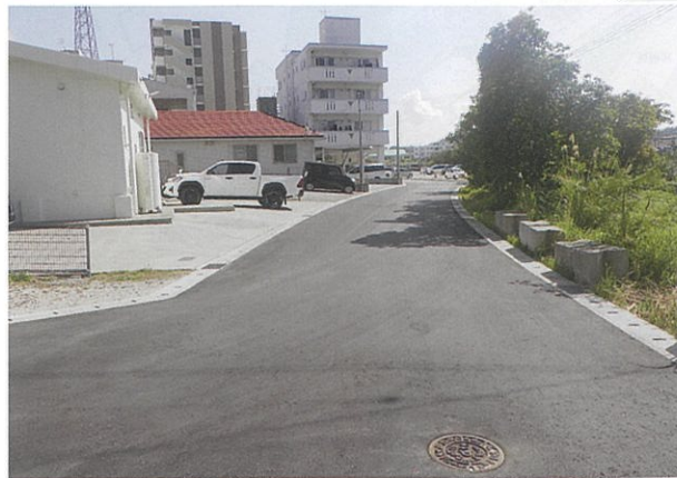
津嘉山1490-5番地周辺 工事完了