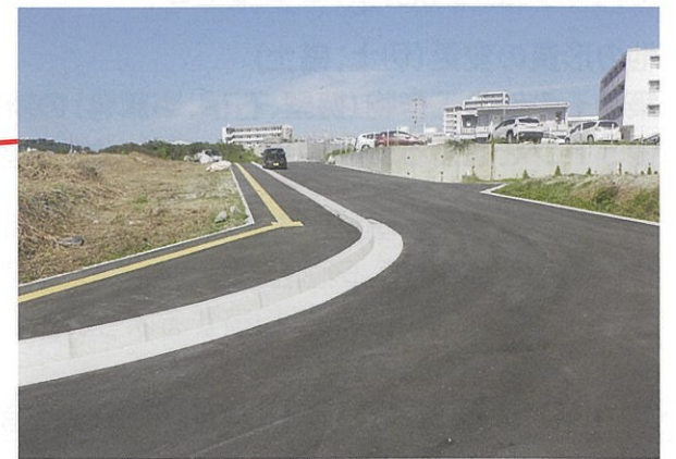
津嘉山495番地周辺 工事完了