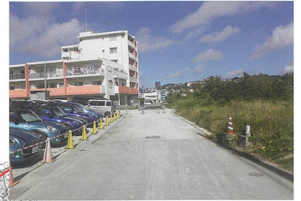
津嘉山1208-4番地周辺 工事中