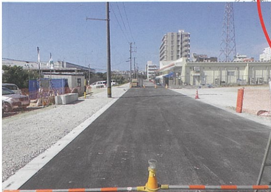
津嘉山1519番地周辺 工事中