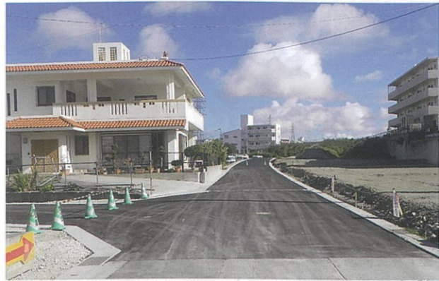
津嘉山1464-3番地周辺 工事完了