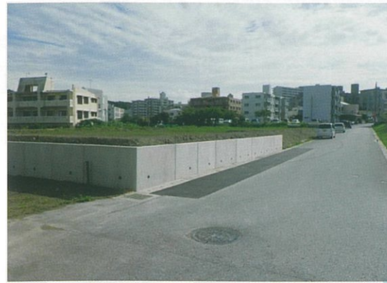
津嘉山1176-2番地周辺 工事完了