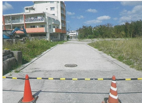
津嘉山1204-1番地周辺 工事中