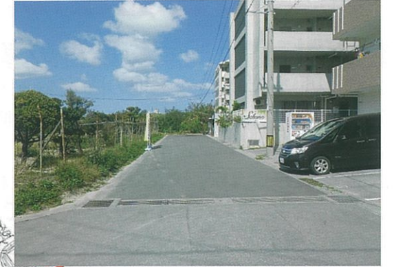
津嘉山1097-1番地周辺 工事完了