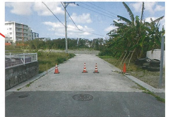
津嘉山1205-12番地周辺 工事中