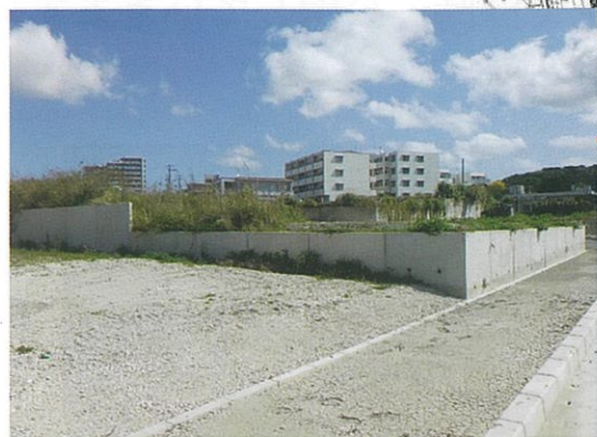
津嘉山495番地周辺 工事完了