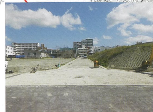
津嘉山486番地周辺 工事中