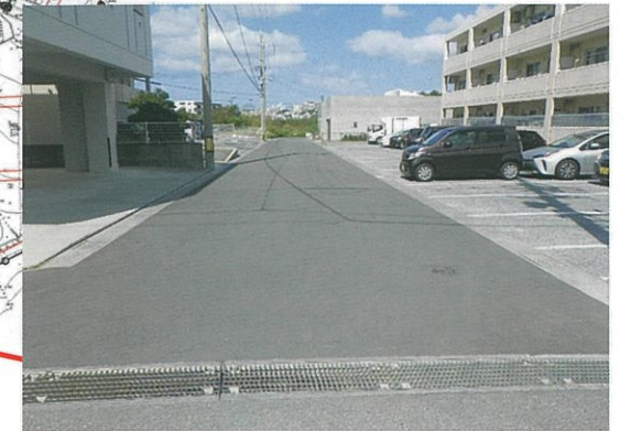
津嘉山1093-1番地周辺 工事完了